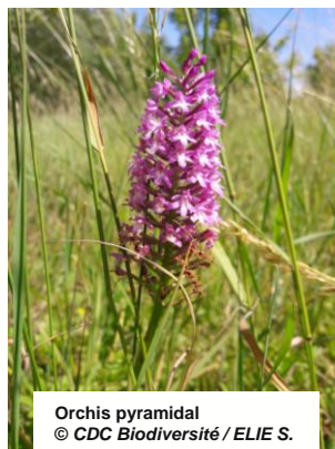
Orchis pyramidal